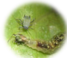
Larva de la mosca de las flores comiendo pulgones.