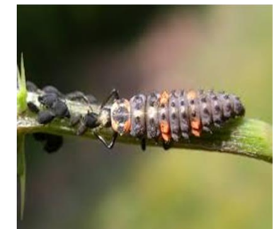
Larva de Mariquita comiendo pulgones