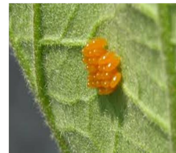
Huevos de Mariquita