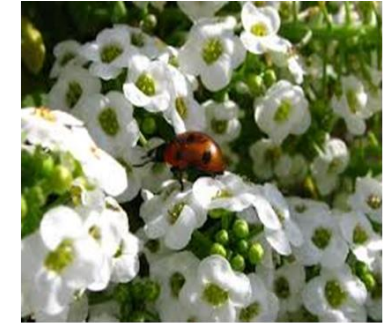
Mariquita adulta comiendo néctar y