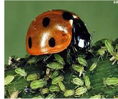
Mariquita adulta comiendo pulgones

Recuerda siempre tener flores para ella.