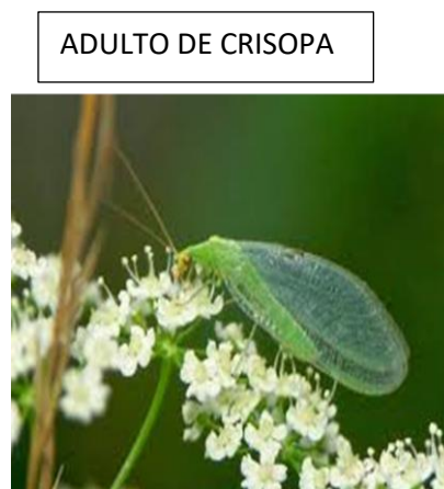
ADULTO DE CRISOPA