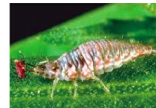
LARVA DE CRISOPA