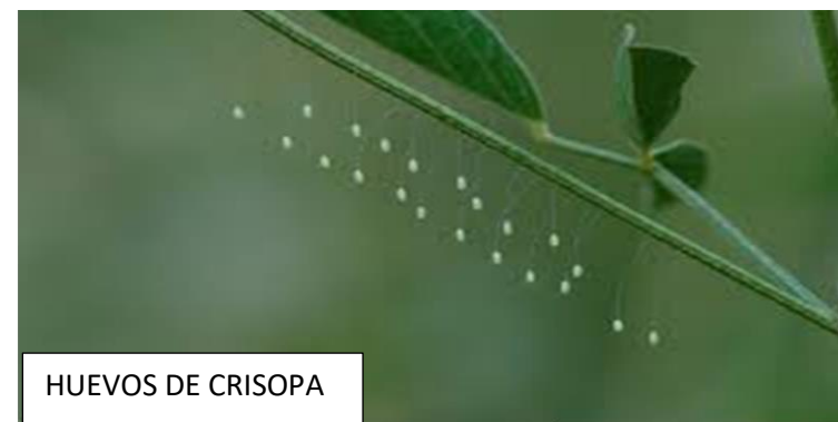
HUEVOS DE CRISOPA

Por lo tanto, debemos tener siempre, plantas con flores en nuestro huerto.