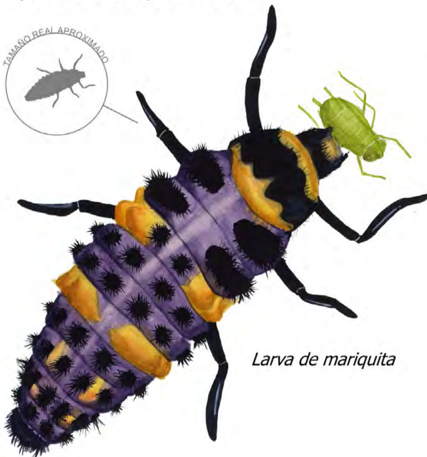
Larva de mariquita

La larva es alargada, de coloración oscura violácea con manchas anaranjadas y aspecto algo espinoso. Poseen patas que las hacen muy móviles. Pueden alcanzar 8-10 mm.