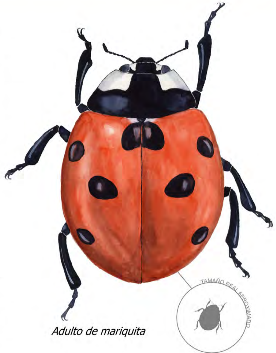
Adulto de mariquita

Los huevos son alargados de color amarillento, colocados en grupos de 10-20. Se sitúan en el envés de la hoja y no hay que confundirlos con los del escarabajo de la patata, que sólo los pone en ésta.