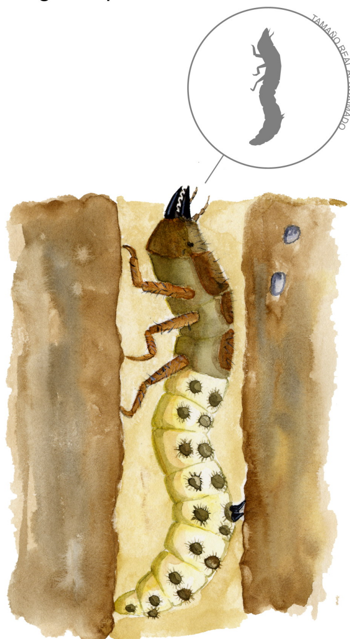
Larva en la boca del túnel

Las larvas se ven favorecidas en los suelos arenosos o bien drenados y los adultos por suelos con vegetación baja y zonas con piedras como muretes o montículos pedregosos. Se han observado con frecuencia numerosos ejemplares alrededor de concentraciones de agua como los charcos dejados por una goma picada.