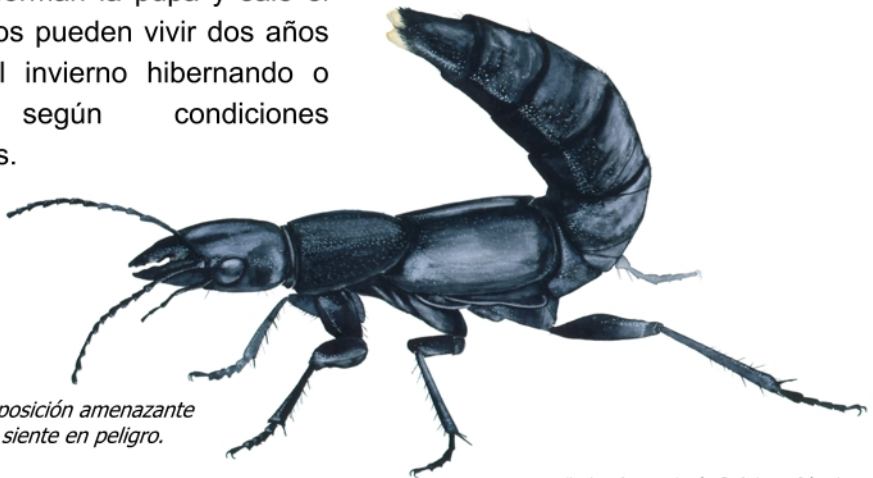
Adulto en posición amenazante cuando se siente en peligro.

No los podremos ver en zonas con suelo desnudo, sin cubiertas, sin lindes con flora arvense, sin materia orgánica ya que no le favorecen los ambientes secos y muy expuestos al sol. Por el contrario, zonas con cubierta vegetal, flora arvense, materia orgánica, cultivos asociados, acolchados... proporcionan ambientes protegidos y frescos, favoreciendo el desarrollo de este insecto. Si queremos ver si hay en nuestra zona, es fácil encontrar adultos y larvas en campo refugiados bajo tablas, cajas, balas de paja, materiales de riego amontonados, en los montones de compost o estiércol... No son venenosos pero pueden morder.